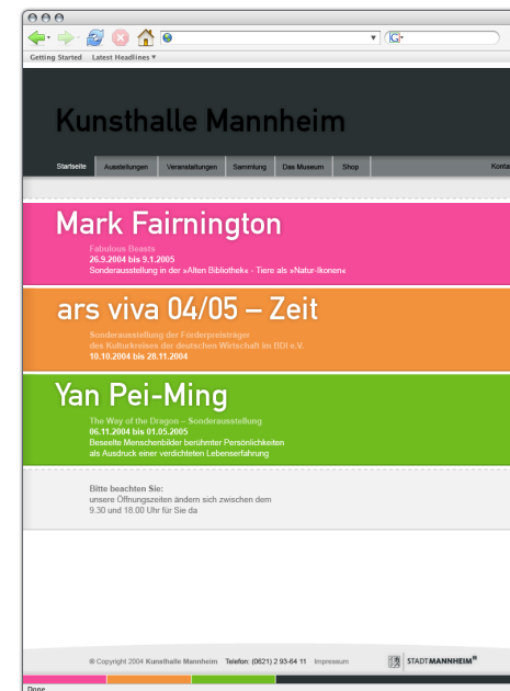
Frontend der öffentlichen Webseite.